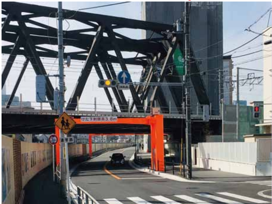
・鉄道工事に伴い 橋梁の架替を実施 交通の見通し確保 歩道拡幅で歩行者の安全確保