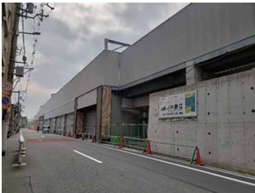
・JR野江駅は京阪本線・地下鉄谷町線乗り換え可