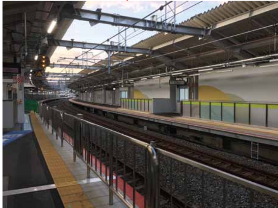
・JR鳴野駅の改築も完成 地下鉄今里筋線乗り換え可